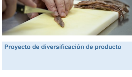
Proyecto de diversificación de producto