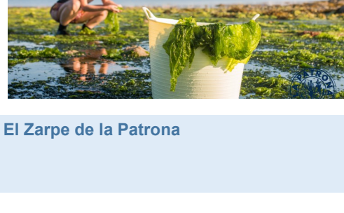
El Zarpe de la Patrona

Poner en valor un producto que actualmente se desecha (salmuera) y que es altamente valorado por el mercado, principalmente, por el sector de la alta restauración.