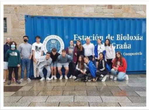
Estación Biolóxica da Graña