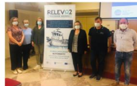
"RELEVO2_Mocidade Abordo" es el programa de colaboración de los GALP Ría de Vigo-A